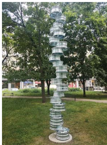
V současné době probíhá na území našeho obvodu Landscape festival, jehož součástí je celá řada uměleckých

instalací. Jednou z nich je prostorová kompozice NE-STABIL významného plzeňského sochaře Benedikta Tolara. Umělecké dílo je umístěno v parku vedle Domu umění směrem k Denisově ulici. Autor svým dílem odkazuje také na jiné umělce, koncepce na britského sochaře Tonyho Cragga, známého pro své balancující sochy (např. Point Of View nebo Bust), a názvem na významného českého sochaře Stanislava Kolíbalu (např. Labil – Stabil). Dílo nese podtitul Balancování na hraně stability... Co rovnováha ještě unese, a kdy se z bortí. Současně v něm lze nacházet i vzpomínky na dětské hry, jako bylo stavění věží z kostek. Přesně takové po-city by současné umění mělo vyvolávat a věřím, že taková díla budou vznikat ve veřejném prostoru Ostravy i nadále.