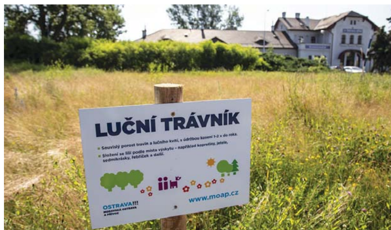
Zelené plochy se sníženou intenzitou pokosu jsou označeny touto cedulí.

Všichni přítomní se shodli na tom, že ze strany městského obvodu se jedná o zajímavou aktivitu, kterou má smysl dále rozvíjet a sledovat. Městský obvod nyní ve spolupráci s nimi připravuje nové internetové stránky, na kterých bude prezentovat průběh a výsledky takového „zelených“ projektu.