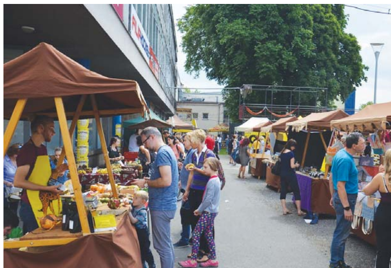
Nejrůznější domácí i exotické produkty nově nakoupíte na trzích před budovou Coolturu na Černé louce.

V červnu byly na Černé louce před budovou Coolturu zahájeny Trhy, co se hledají, které si kladou primárně za cíl